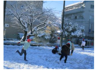
雪の中で遊ぶ子ら